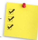
TABLEAU SYNTHÈSE FRAIS DU SERVICE DE GARDE